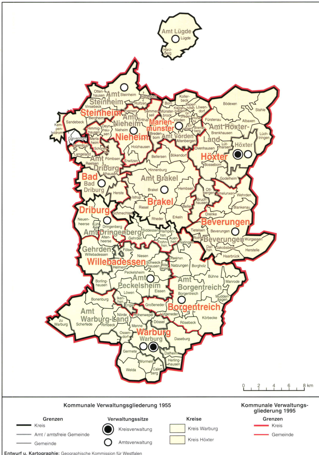
Abb. 3: Kommunale Verwaltungsgliederung 1955 und 1995

des Kreises liegt die Kreisstadt ebenfalls peripher an der äußersten Ostgrenze. Außerdem liegt der Kreis Höxter gewissermaßen im 'toten Winkel' zwischen den wichtigsten Verkehrslinien und Siedlungsbändern der Entwicklungsachsen erster Ordnung Ruhrgebiet-Bielefeld-Hannover-Berlin und Ruhrgebiet-Kassel.