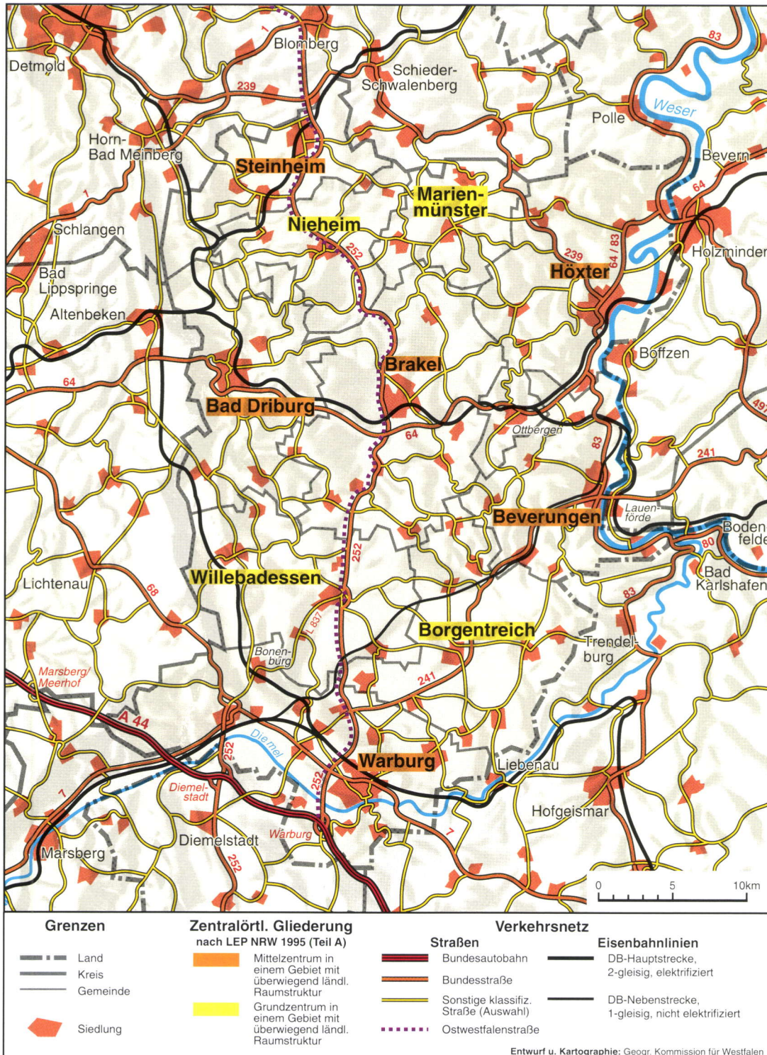
Abb. 4: Zentralörtliche Gliederung und Verkehrsnetz

ten als die Bundesregierung aus dem Grünen Plan erhebliche Mittel zur Verfügung stellte. Die neuen landwirtschaftlichen Betriebe liegen als Einzelhöfe in breiten Ringen um die Stadtkerne herum. Durch diese neuzeitliche Aussiedlung wurde der oben beschriebene mittelalterliche Wüstungsprozeß hier in gewisser Weise rückgängig gemacht.